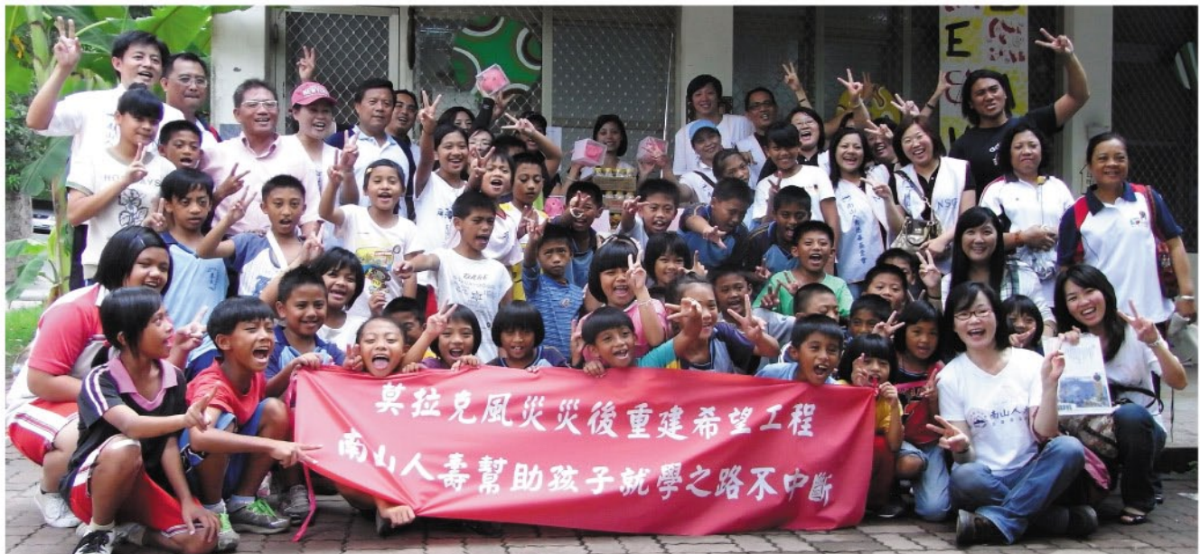
屏東分公司的同仁與泰武國小的小朋友提前歡度中秋佳節。

截至10月底，這項急難救助關懷行動協助近60所學校及弱勢團體，幫助近千名受災學童。生活與家園的重建是條漫長而艱辛的路程，但是孩子就學之路不能中斷，南山人壽慈善基金會將持續關懷災區兒童教育問題，期能幫助他們早日回復正常生活，就學不中斷、迎向未來。