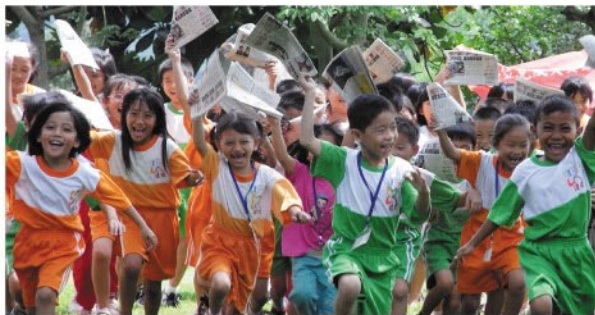
南山人壽慈善基金會捐助屏東縣六所受災學校「讀報教育計劃」經費。