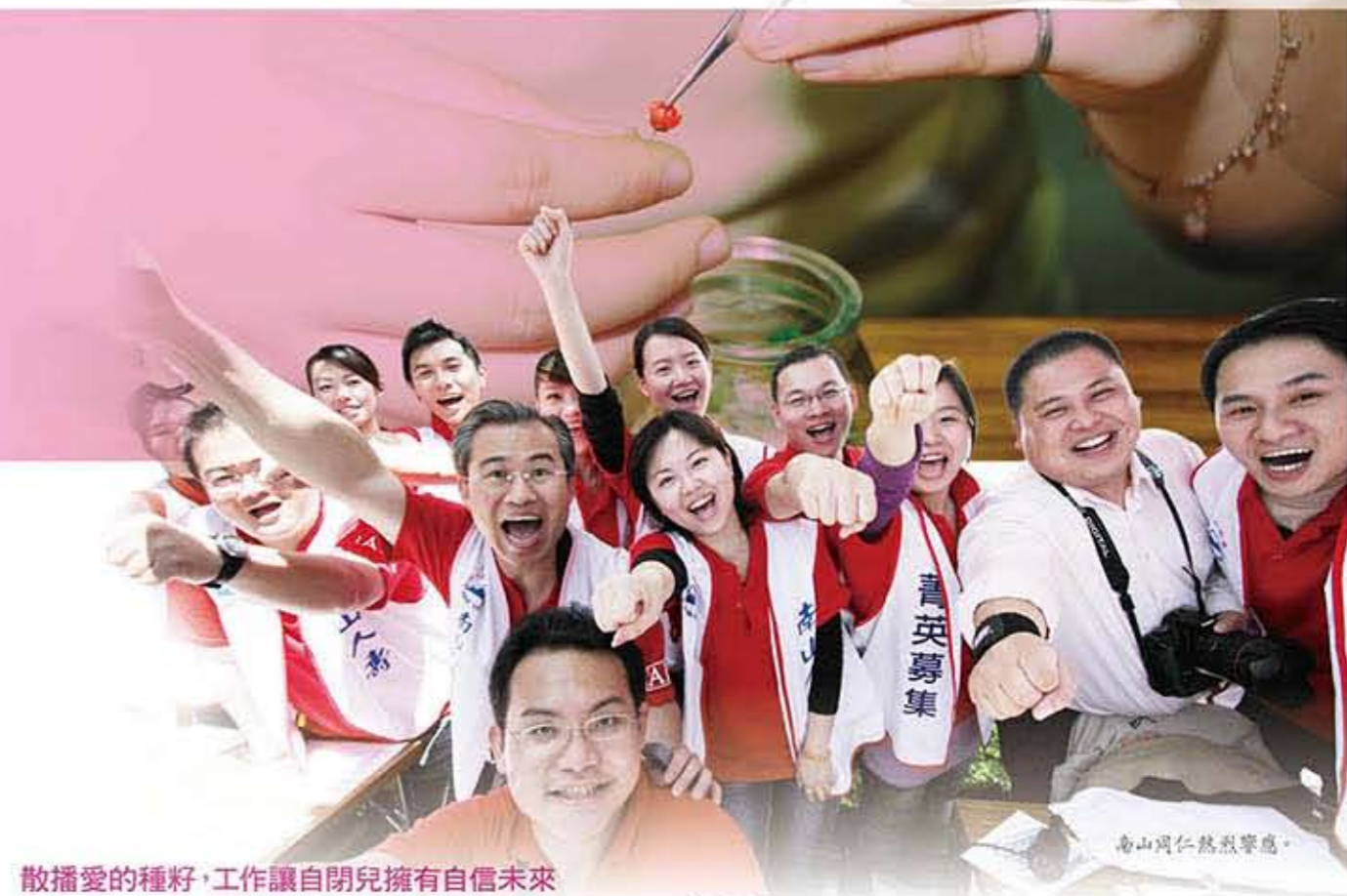
南山同仁熱烈響應。