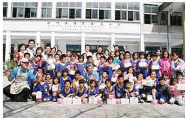
南山人壽同仁們和喜憨兒基金會以及錦屏國小的師生開心合影留念。