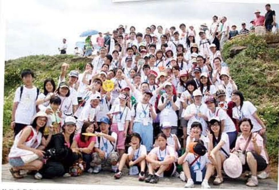
陪伴唐寶寶有機會體驗團體生活和離家外宿的特別經驗，提升生活自主能力，同時有機會走出戶外與社區互動，使社會大眾更認識他們的純真、可愛與貼心。