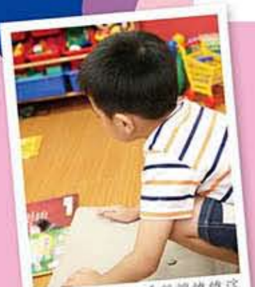
透過這次活動，希望跟像他這樣的小朋友，能有一個溫馨、快樂的童年。

2008年底，全球遭逢前所未見的金融海嘯衝擊，在這惡劣景氣下，許多企業選擇精簡人力來度過，如此，一波波的裁員讓一般家庭的經濟遭逢前所未有的困境，而經濟弱勢的家庭更是雪上加霜，三餐幾乎無以為繼。有鑑於此，政府發行消費券，除了刺激消費外，也意外讓民眾有幸中獎的機會。