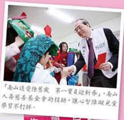
「南山送愛除舊歲 第一寶貝迎新春」，南山人壽慈善基金會的捐助，讓心智障礙兒童學習不打烊。