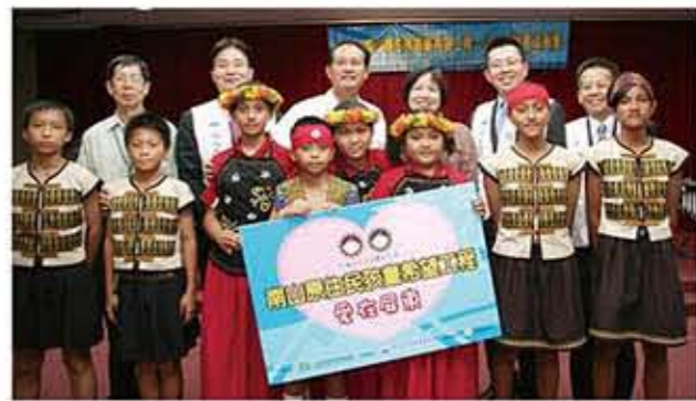
第三年推動的「原住民孩童希望工程」選在屏東舉辦，希望幫助原 住民孩童建立正確的金錢及消費價值觀。

教育，給予孩子們有希望的未來，雖然營隊是短暫的， 但金融教育的種子已經萌芽，這項希望工程幫助原住民孩 子們累積知識與競爭力，開創美好的未來！