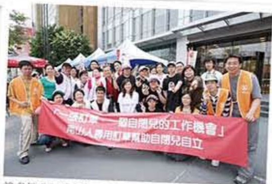
讓我們用訂單來幫助自閉兒擁有一個工作機會，融入社會，迎向有希望的未來！