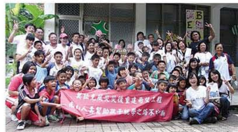
不希望因為風災而損失了孩童的就學權利，南山人壽慈善基金會幫助受災孩童就學的路不中斷！

南山人壽慈善基金會於莫拉克風災後全力投入救災，及時給予最迫切的急難救助，獲得內政部頒發「救災有功團體」的獎章，也是壽險業唯一獲獎者。