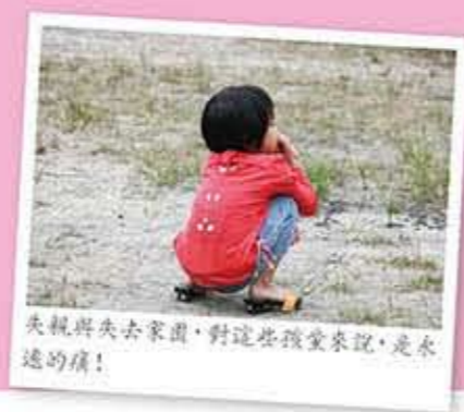
失親與失去家園，對這些孩童來說，是永遠的痛！