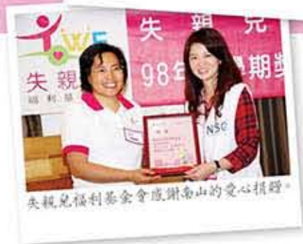
失親兒福利基金會感謝南山的愛心捐贈。