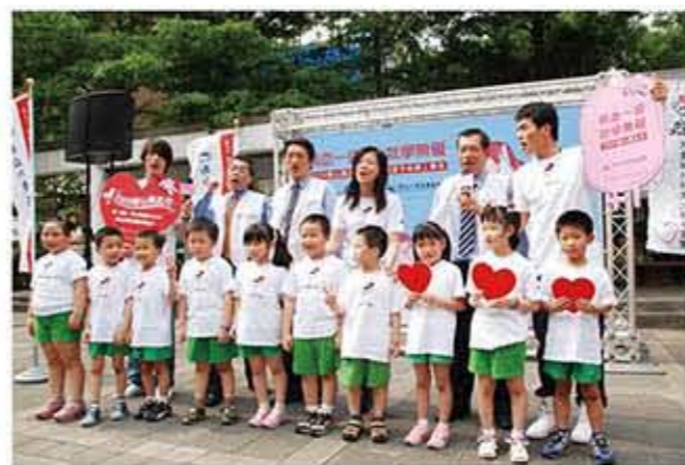
捐血一袋·不只能救人·還能幫助弱勢家庭的孩子上學·更能讓自閉兒獲得自立的工作機會!

而民眾捐一袋血的力量·除了協助弱勢兒童能安心學習·還能幫助自閉症孩子學習自立生活·南山人壽慈善基金