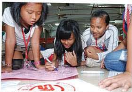
在小小金融家成長營，原住民兒童展現十足創意。

「南山原住民孩童希望工程-小小金融家成長營」， 扎根金融知識教育，培養原住民孩童擁有受用一 生的金融理財觀念。