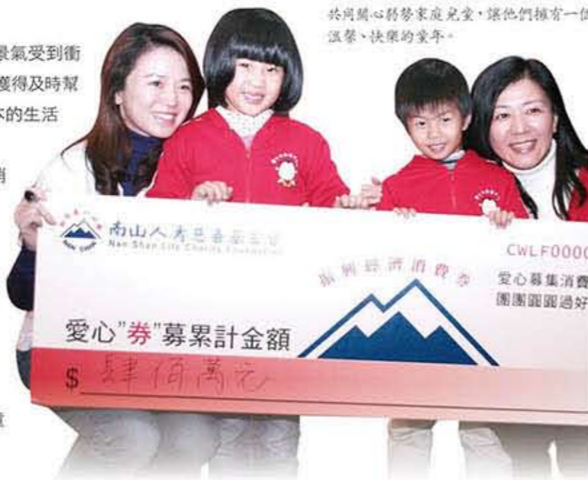
透過活動掀磚引玉，期盼號召社會大眾於同關心弱勢家庭兒童，讓他們擁有一個溫馨、快樂的童年。

南山的力量很大，這波愛心「券」募活動，單靠南山同仁們之力，即募集了5,261位南山人的愛心，金額達4,210,721元新台幣(含消費券與現金)，這對兒福聯盟來說，是一筆很大的捐款，也發揮急難救助之用，幫助貧困家庭及孩童度過一個溫暖的冬天。