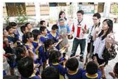
錦屏國小的孩子們一齊來教南山人壽同仁們學習泰族式的歡呼。

關懷弱勢及身心障礙孩子，進一步幫助他們學習自立 能力，是南山人壽慈善基金會致力慈善公益志業長期著力 的重點之一。響應喜憨兒基金會「送愛到部落」的關懷活 動，一方面希望能拋磚引玉號召社會大眾，一同關懷偏遠部 落孩童，另一方面與民間社福團體攜手合作，也能實際幫助