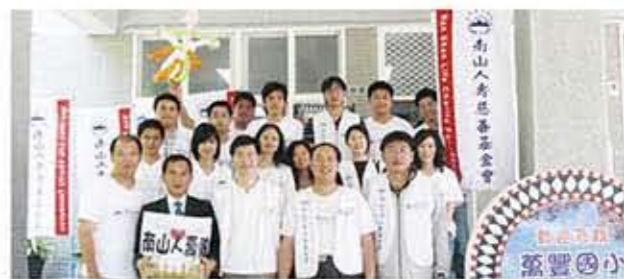
關懷部落孩童的健康，南山人壽同仁親自到仁愛鄉萬豐國小捐贈保久乳。

南投分公司有感於南投縣內部落原住民多以打工維生，家長因為收入有限經常無法為孩子準備早餐，長期下來，部落學童營養攝取不足，體型平均比平地孩子瘦小，也常生病，影響學習進度，因此，結合基金會一同捐助南投縣仁愛鄉萬豐國小134箱保久乳，為他們補充營養，幫助他們健康地長大。