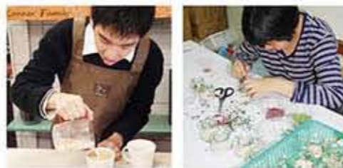
把小小的乾燥花放在杯子裡需要高度耐心及毅力才能完成。