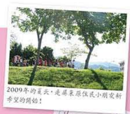
2009年的夏天，是屏東原住民小朋友新希望的開始！

如此，從「小小金融家成長營」的示範作用，到2009年金融基礎教育的推動， 一步一腳印，讓我們看見孩子們美好的未來！