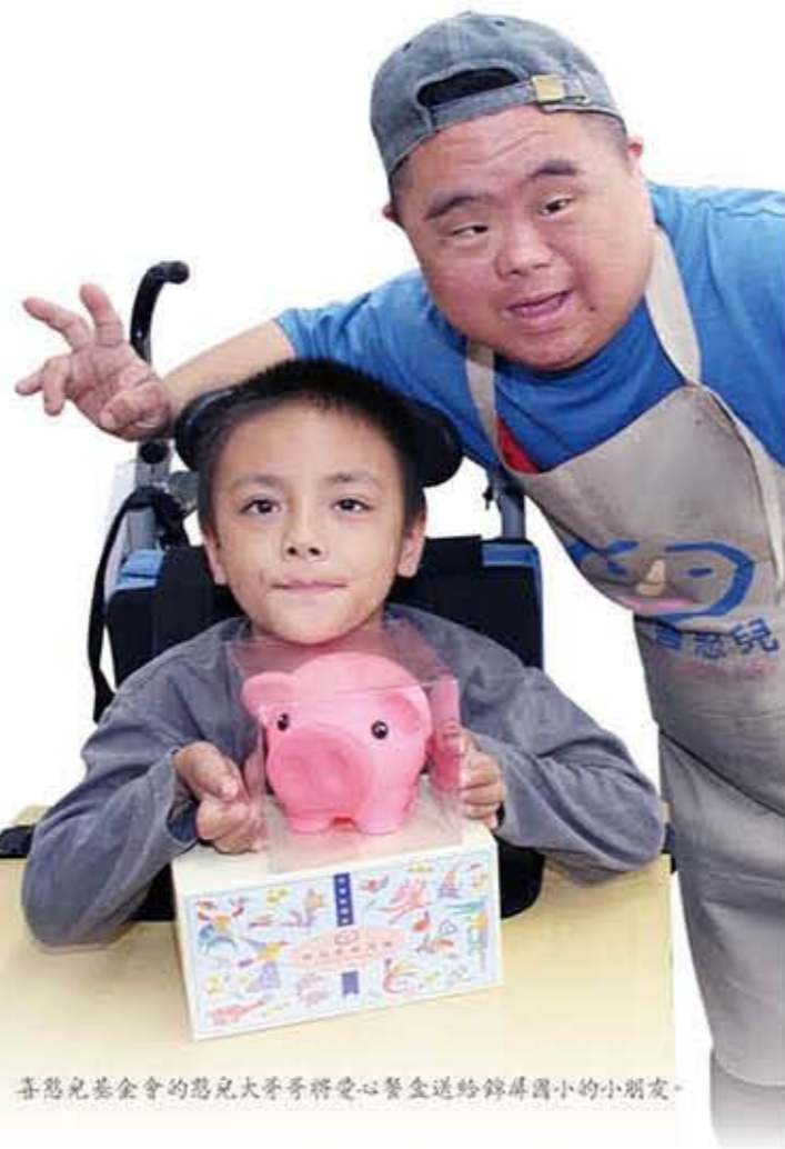
喜憨兒基金會的憨兒大哥哥將愛心餐盒送給錦屏國小的小朋友。

這一天，南山人壽的同仁與憨兒大哥哥， 不僅送來了一年份營養，傳達了喜憨兒努力的故事， 而樂天的原住民小朋友們，更與這群溫暖的人們玩在一起， 用泰雅族式的歡呼交流了情感，共同歡度這個與眾不同的日子， 彼此交流、分享、回饋。 南山人壽慈善基金會巧妙地將資源效益擴大， 溫暖了兩個弱勢族群。