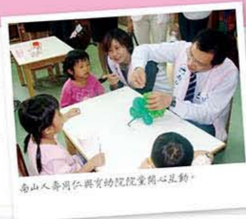
南山人壽同仁與育幼院院童開心互動。