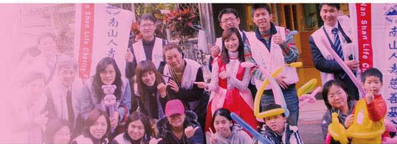
愛要延續！期望透過南山人壽的拋磚引玉，讓更多人對育幼院付出關懷。