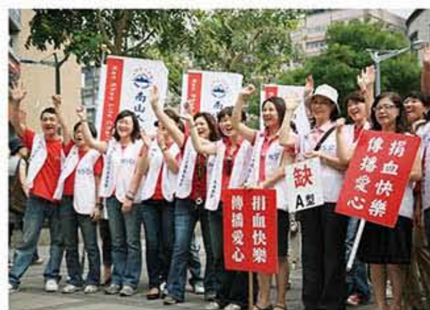
南山人樂做快樂捐血人·幫助更多孩童開心上學去!

會自成立以來即關注自閉兒福利相關議題·也因此捐血月活動特地選購了由中華民國自閉症總會——「星兒工坊」生產的純手工果凍蠟燭作為捐血紀念贈品·透過愛心採購·提供自閉症朋友更多工作機會·2009年的南山捐血月活動·共募得10,184袋熱血·共捐出新台幣2,546,000元·匯集了民眾與南山同仁的愛心·成效斐然。