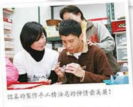
認真的製作手工精油皂的神情最美麗！