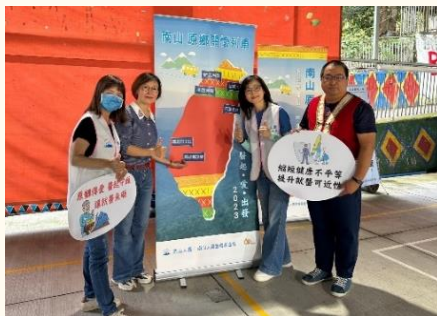
南山原鄉關懷列車第六站抵達高雄那瑪夏。

關懷原鄉不畏路途遠、天候差，高雄醫學大學附設中和紀念醫院山地醫療服務團隊35年來深耕原鄉醫療，提供巡迴看診、專科門診，為照護民眾健康付出熱情與心力；鑒於文化及家庭生活習俗有所影響當地學生的健康認知及危害健康的飲食行為，近年更積極著力於提升原住民學童菸害防制、營養飲食等健康識能，期能及早建立健康生活習慣，以維護身體健康。