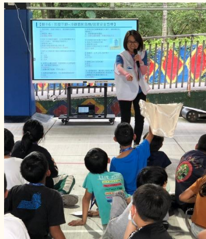
闖關遊戲讓孩子們在玩中學習。