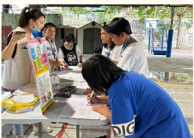
現學現賣，畫出我的健康餐盤。

台灣陽光更燦爛的熱情，來到位於達卡努瓦部落的民生國小，與現場近40位學童一起互動遊戲，嘻笑聲與山林蟬嘶鳥鳴較勁，掀開快樂暑假序幕。