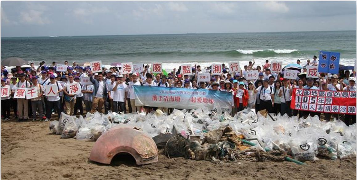
▲ 近六千位義工夥伴熱情參與淨灘。