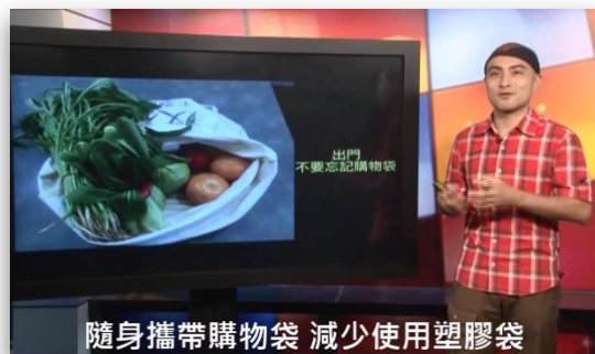
▲ 邀請環保專家分享生活減塑經驗。

從生活中力行減塑，是減少海洋廢棄物的不二法則，為此，邀請環保專家透過線上課程分享，讓同仁有系統地汲取海洋汙染、淨灘、生活減塑等知識與觀念，共超過7,700人次完成課程；並於南山官網FB舉辦「減塑EASY GO·一起愛地球」活動，透過網路活動，號召同仁及社會大眾力行減塑生活，重視海洋環保議題，總共近50,000人次響應生活減塑。